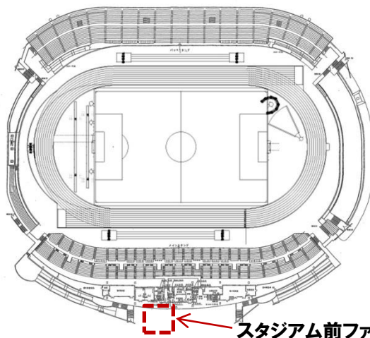
スタジアム前ファジステージ

試合開始3時間30分前～1時間前のうち、 ご希望の時間(2時間30分のうち、2ステージ程度)